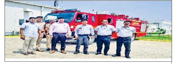
मारुति संयंत्र में सुरक्षा प्रबंधों को परखते एसडीएम व अन्य अधिकारी