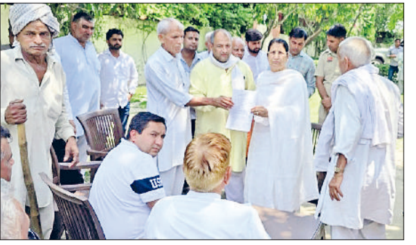
राई। विधायक कृष्णा गहलावत जनता दरबार में लोगों की समस्या सुनते हुए।

गांव के सरपंच व अन्य लोगों ने दुर्गा कालोनी से रामनगर गली का निर्माण करवाने की मांग की। विधायक ने अधिकारियों को उक्त समस्या के समाधान के आदेश दिए। विधायक गहलावत ने कहा