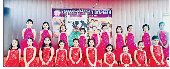
खरखोदा। प्रभावशाली प्रस्तुति देते कल्पना विद्यापीठ की छात्राएं।