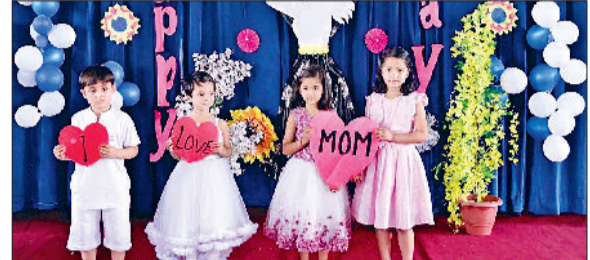
खरखोदा। मनमोहक प्रस्तुति देते प्रताप स्कूल के विद्यार्थी।