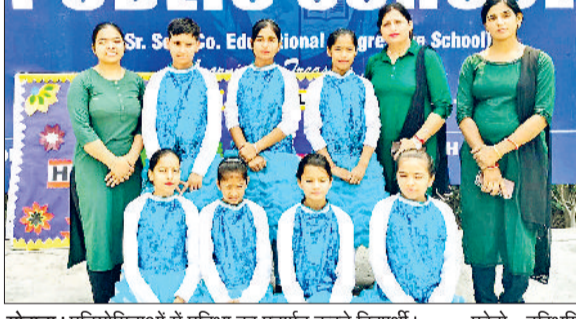
गोहाना। प्रतियोगिताओं में प्रतिभा का प्रदर्शन करते विद्यार्थी।