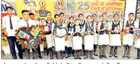
गोहाना। कार्यक्रम में प्रस्तुति देते शेर सिंह पब्लिक स्कूल के विद्यार्थी।