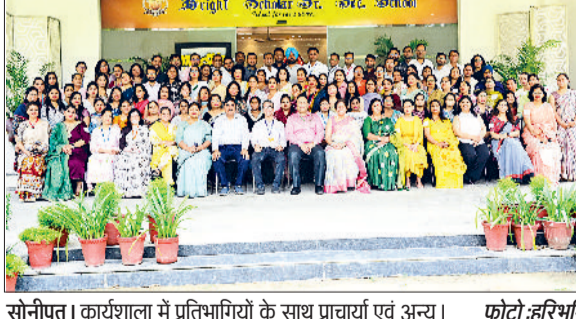
सोनीपत। कार्यशाला में प्रतिभागियों के साथ प्राचार्या एवं अन्य।