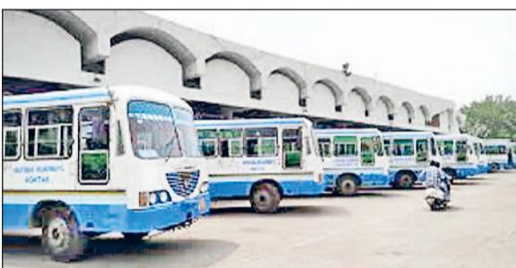
प्रभावित होना शुरू हो गया था। पहलगायाम में हुए आतंकी हमले से पहले सोनीपत से कटरा रूट पर प्रति बस रोडवेज विभाग की 70 से 80 हजार रुपए की टिकट बिक्री होती थी, लेकिन उसके बाद टिकटों की बिक्री में जबरदस्त कमी आई और यह 40 से 45 हजार रुपए प्रति बस तक ही सीमित रह गई थी। वहीं अब जालंधर से आगे सोनीपत से कटरा रूट की बसों को नहीं भेजने का फैसला रोडवेज विभाग द्वारा किया गया है।

भारत और पाकिस्तान के बीच पैदा हुए तनाव का असर रोडवेज विभाग की सेवाओं पर देखने को मिल रहा है। सोनीपत से कटरा रूट को रोडवेज विभाग द्वारा जालंधर तक सीमित कर दिया है। इससे आगे बसों को सुरक्षा कारणों के चलते नहीं भेजा गया। ऐसे में कटरा जाने वाले यात्रियों को हल्की परेशानियों का सामना करना पड़ सकता है। बता दें कि भारत और पाकिस्तान के बीच पिछले तीन दिनों से तनाव चरम पर है। जम्मू-कश्मीर सहित भारतीय सीमाओं के साथ लगते राज्यों में विशेष तौर पर सतलुजा बरती जा रही है। हालांकि सोनीपत-कटरा रूट पहलगायाम में हुए आतंकी हमले के बाद से ही