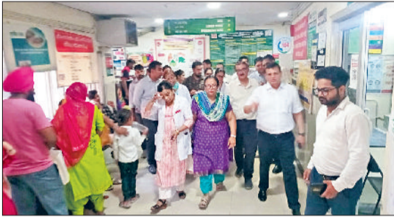
सोनीपत। ओपीडी में निरीक्षण करते एनएचएम निदेशक।

आपातकालीन स्थिति से निपटने के लिए विशेष वार्ड तैयार करने के निर्देश दिए। हरिभूमि न्यूज ॥ सोनीपत